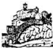
Pro loco Miranda