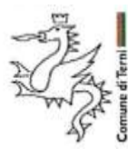
Patrocinio Comune di Terni