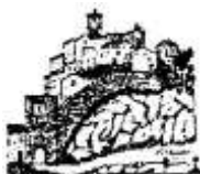
Pro loco Miranda