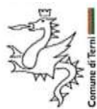
Patrocinio Comune di Terni